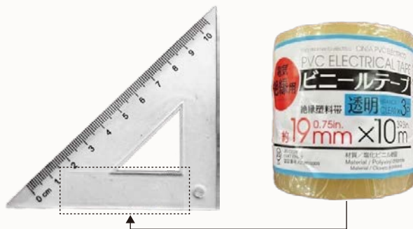
図1:滑りやすい定規の裏側にビニールテープを貼り付けると滑りにくくなります

市販品では「Qスケール15(販売:株式会社ゴムQ)」(図2)、「ピタットルーラー(販売:mochimono)」(図3)などがあります。ご興味のある方はぜひお試しください。