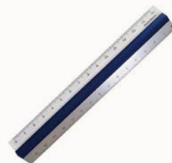
ピタットルーラー(mochimono)