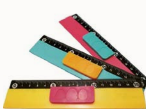
図2:Qスケール15(株式会社ゴムQ)